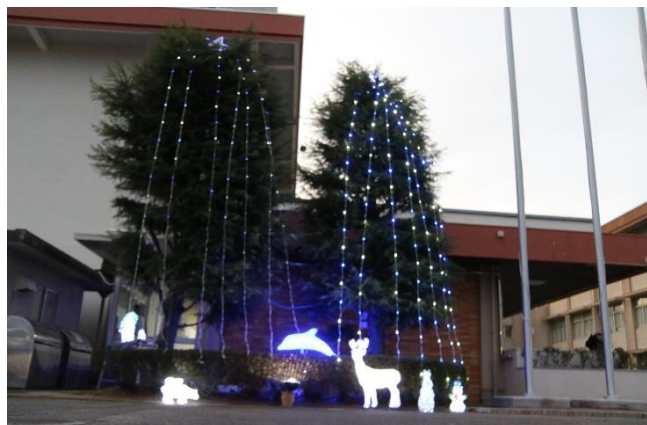
イルミネーション点灯式(12月)

保護者の皆様を始め中学校の先生方のご理解とご協力、生徒と顧問教師のマーチングに対する真摯な取り組みと不断の努力により実を結ぶことができました。ご声援ありがとうございました。