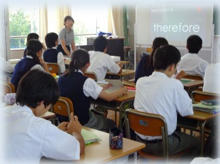
ICTを活用した教材の提示